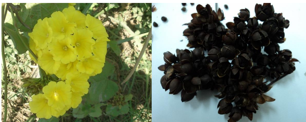
Figura 2. Fotografías de la planta y semillas de Merremia umbellata .

en las muestras, además esta planta tiene actividad diurna, en cambio, I. alba es una planta de actividad nocturna, y su crecimiento solo se ve favorable en zonas con suelo arenoso y húmedo, lo que limito la representatividad en las muestras de esta especie en los sitios de colecta (Figs. 2 y 3).