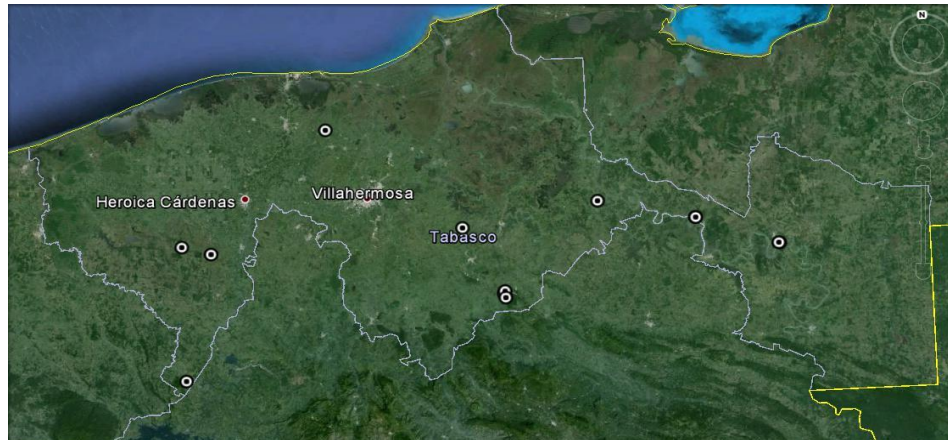
Figura 1. Mapa del estado de Tabasco, indicando los sitios de colecta (Google Earth®).