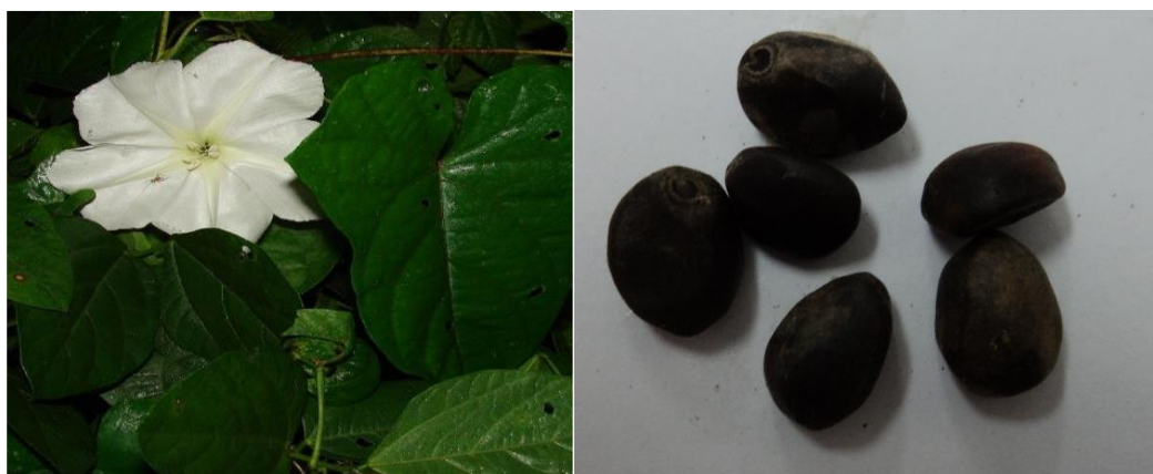
Figura 3. Fotografías de la planta y semillas de Ipomoea alba .

La emergencia de los escolitinos en ambas especies de plantas hospederas se da en los meses de febrero, marzo, mayo y junio lo cual nos indica que los períodos de reproducción del insecto están marcados en estos meses. En M. umbellata la abundancia es baja en cada muestra debido a la limitación del alimento al competir por este con especies de brúquidos, por otra parte I. alba tiene distribución limitada ya que requiere de condiciones específicas para establecerse, además hasta el momento no se encuentra asociada a alguna otra especie de insecto que este compitiendo por alimento con los escolitinos por lo que nos explica la mayor emergencia en este estudio (Cuadro 1).