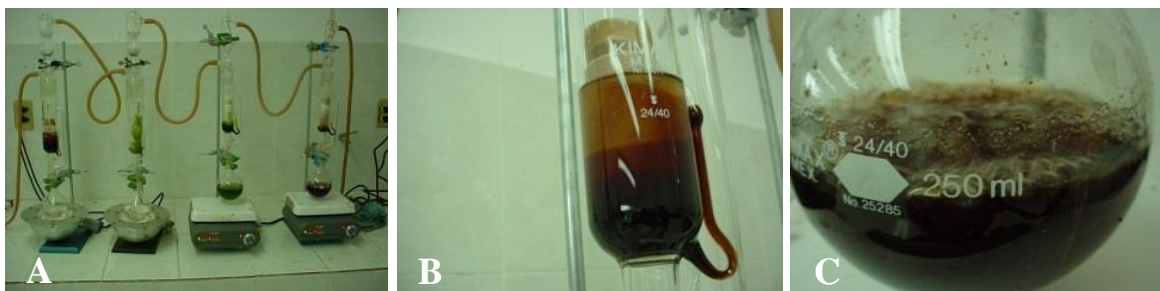
Figura 1. Elaboración de los extractos etanólicos. A) Equipo soxlet con cada una de las especies. B) Reflujo de los extractos C) Concentrado de la extracción en matraz balón.

Obtención de los extractos. La extracción se llevó a cabo utilizando (90 g) de muestra seca en polvo obtenida de los frascos previamente almacenados. Para la extracción se utilizó 600 ml de etanol como solvente. Un equipo Soxlet se mantuvo en ebullición durante cuatro horas hasta alcanzar. Los reflujos se mantuvieron hasta que el color café oscuro desapareció (Fig. 1). A continuación se realizó el filtrado de la solución obtenida, en papel filtro Whatman No. 3. La disolución se evaporó en rotavapor hasta sequedad para después resuspender en agua desionizada.